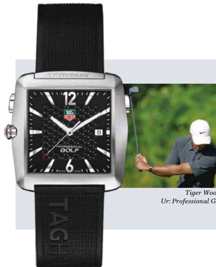
Tiger Woods Ur: Professional Golf

Svenske Annika Sorenstam er én af de få kvindelige golfambassadører, der nævnes på Rolex hjemmesiden, og hun fortjener i allerhøjeste grad at være tilknyttet verdens bedst kendte urmærke. Hun ligger for tiden som nummer to på verdensranglisten, kun overgået af mexicanske Lorena Ochoa – der sjovt nok også er Rolex ambassadør.