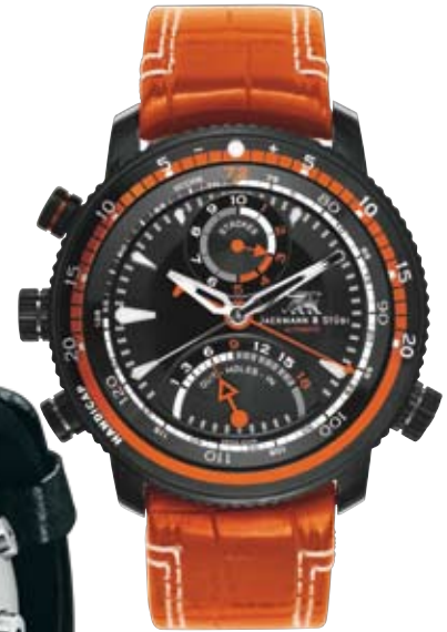
Jaermann & Stübi

menligning. Dette lyder naturligvis ikke særlig imponerende, når man tænker på, hvad førortalt SUUNTO G6 kan tilbyde, men her er der tale om et mekanisk ur og dermed kompliceret finmekanik. Værket er da også så innovativt, at Jaermann & Stübi har patent på det. | • |