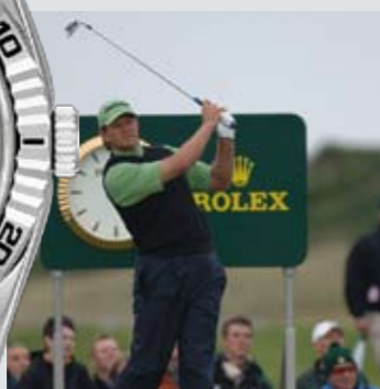
Retief Goosen Ur: Oyster Perpetual