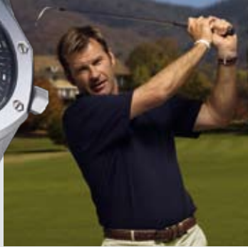
Nick Faldo Ur: Royal Oak